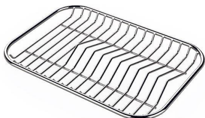
Griglia portapiatti inox 8100 154