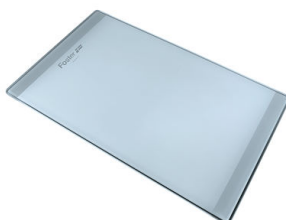
Tagliere in cristallo 8631 300